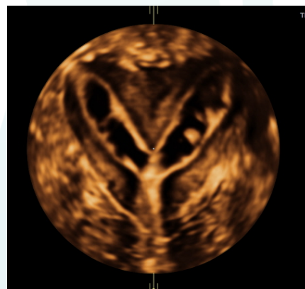
3D virtuális méhtükrözés felvételek